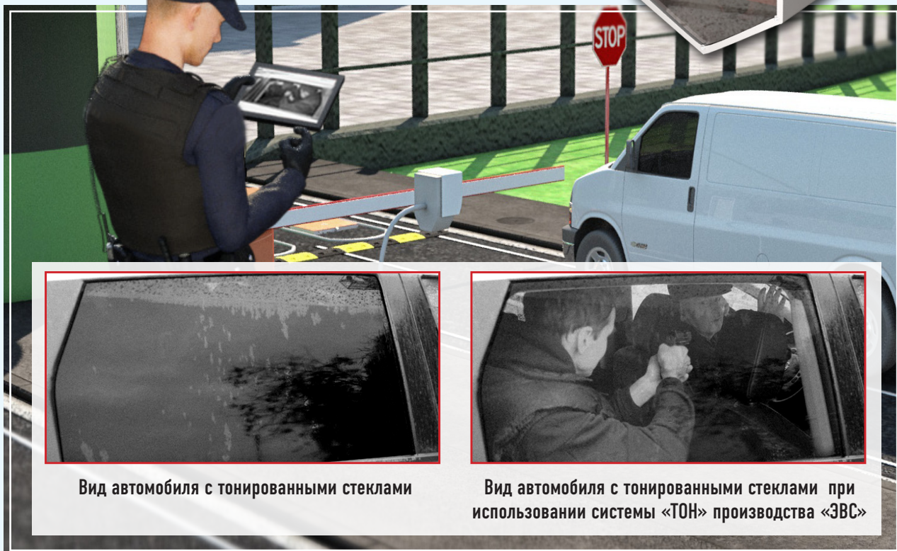
Вид автомобиля с тонированными стеклами